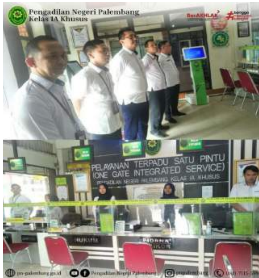
BRIEFING PETUGAS PTSP