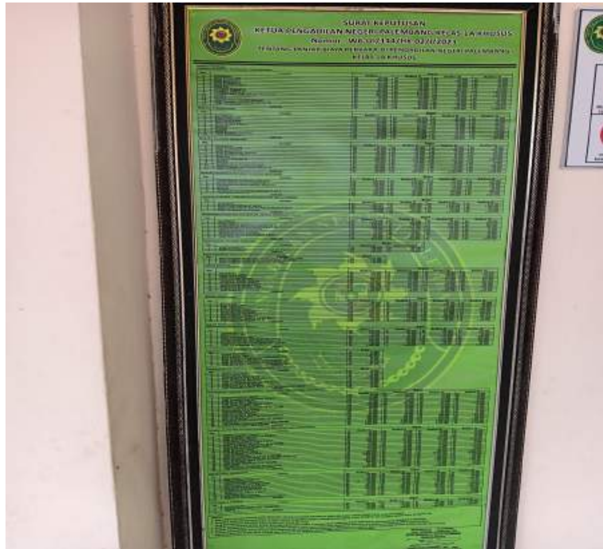
DAFTAR BIAYA SESUAI RADIUS