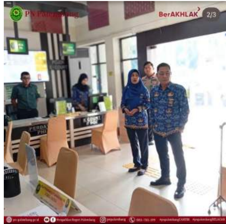
BRIEFING PETUGAS PTSP