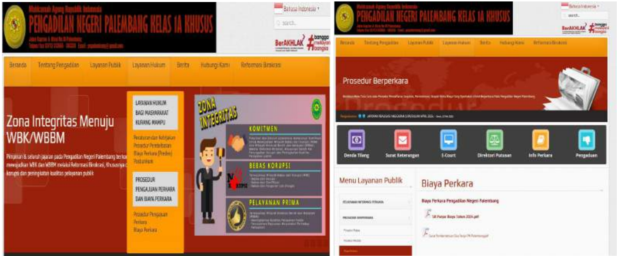
BIAYA PERKARA PADA WEBSITE