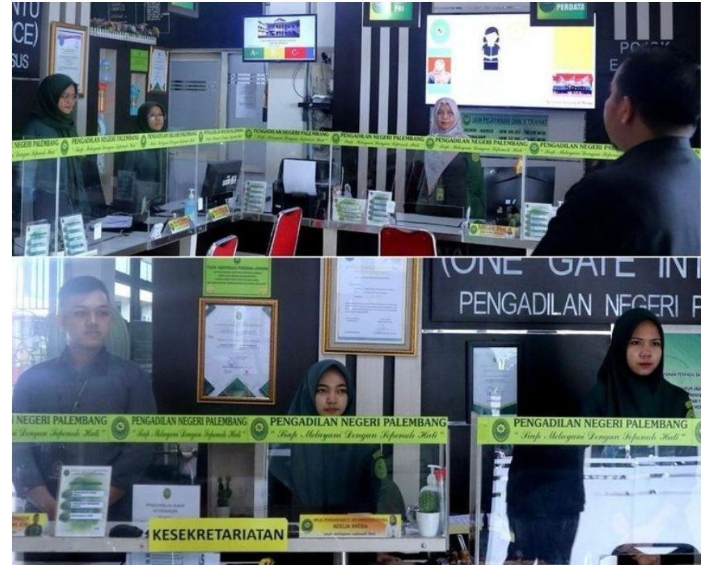
BRIEFING PETUGAS PTSP