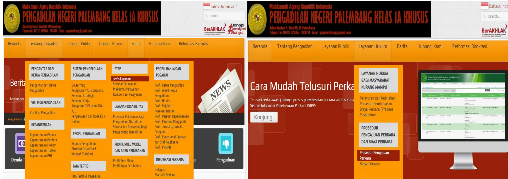
INFORMASI LAYANAN PADA WEBSITE