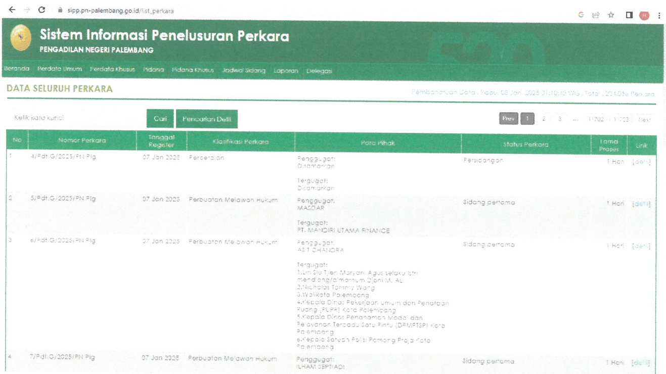
Gambar 2. Aplikasi SIPP Pengadilan Negeri Palembang

Di Meja Informasi juga terdapat seperangkat komputer yang berfungsi sebagai informasi mengenai sistem Informasi Penelusuran Perkara (SIPP) dan pada PTSP Pengadilan juga sudah dilengkapi dengan info media center yang khusus menampilkan agenda persidangan hari ini dan profil pengadilan melalui layar TV 65”.