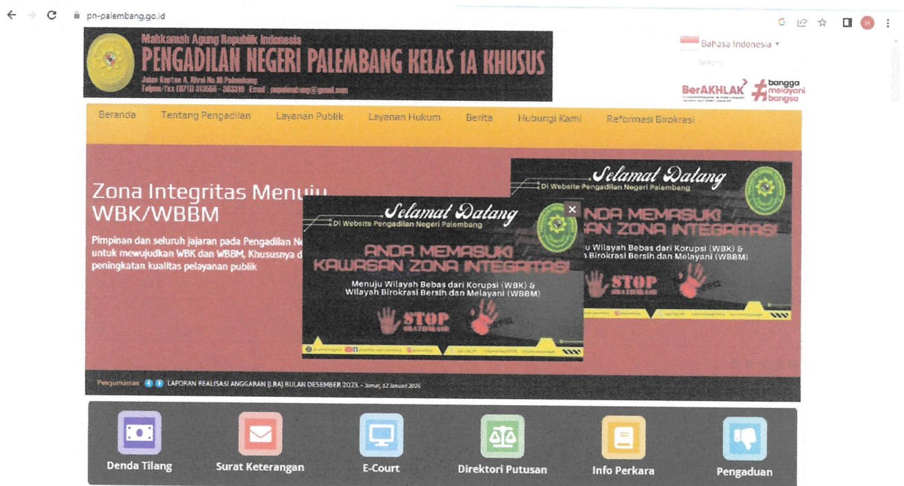
Gambar 1. Website Pengadilan Negeri Palembang.

Pengadilan Negeri Palembang Kelas IA Khusus telah mempunyai website resmi yaitu www.pn-palembang.go.id sebagai fasilitas dalam menerapkan keterbukaan informasi kepada publik, pencari Informasi yang ingin mendapatkan informasi tentang Pengadilan Negeri Palembang Kelas IA Khusus tanpa harus mendatangi langsung dapat mengakses website resmi tersebut, terutama untuk menu informasi yang wajib diberikan atau tersedia.